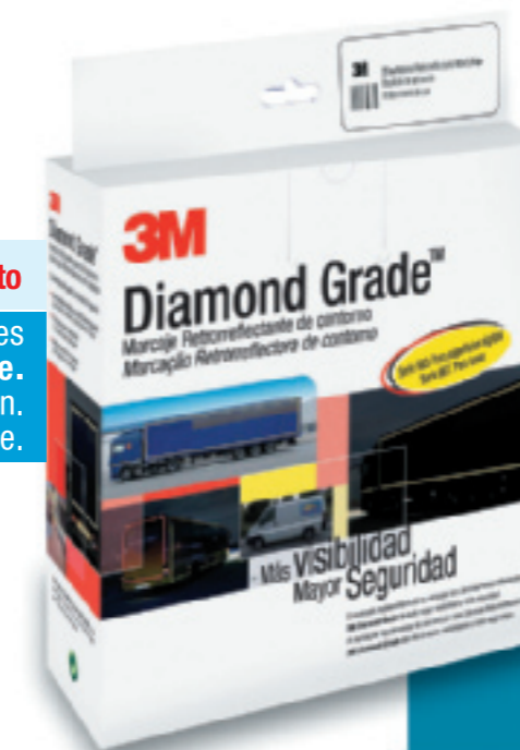
Imagen de homologación según la UN ECE 104